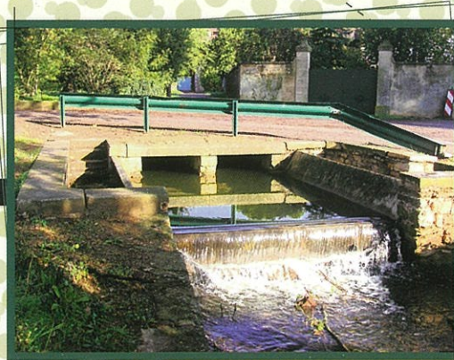
Le lavoire de la Belouze A l'ombre du chêne plus que centenaire, le lavoire de la Belouze, aménagé sur la rivière, invite à méditer sur l'eau qui coule et le temps qui passe...