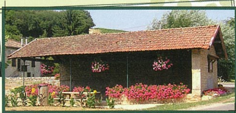
Le lavoire de Chaponnière, fut construit en 1877, puis modifié. Il est situé en bordure du hameau du même nom, connu pour avoir été au x e siècle le berceau historique du village. En levant les yeux, vous admirerez le clocher de l'église ; il fut bâti au xii e siècle et surélevé quelques siècles plus tard.