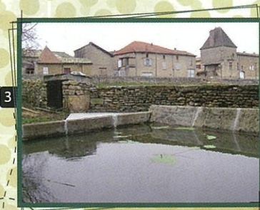
Le Lavoire de Durandis sert surtout d'abreuvoir. Il offre un point de vue intéressant sur le château, élégant mélange de xv e et de xvii e siècle.