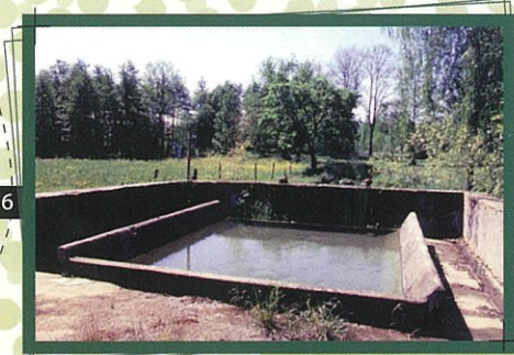
Le lavoire des Plantés Dans un écrin de verdure, le lavoire des Plantés, bien qu'ouvert à tous les vents, donne une impression d'intimité.