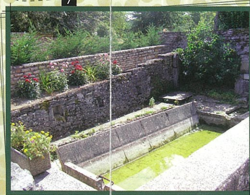
Le lavoire de Chevigne En route vers Prissé, vous devrez chercher le lavoire de Chevigne. Il a gardé tous ses éléments d'origine : la fontaine, l'abreuvoir et le lavoire. De cet endroit, vous apercevrez les toits d'un prieuré dépendant de Cluny, fondé au x e siècle, transformé au xviii e siècle et devenu demeure privée après la Révolution.